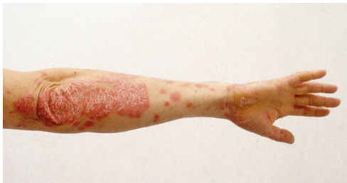
Egy beteg karja a készítmény használata előtt

A pikkelysömör egy gyakran súlyos és gyógyíthatatlan, ugyanakkor tünetmentessé tehető bőrbetegség, amely a magyar lakosság közel 3 százalékát, körülbelül 200 ezer embert érint.